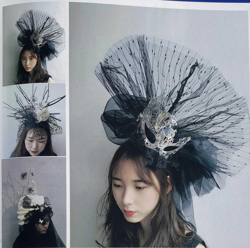
课程名称：《形态构成》 课题一：“帽”——点线面的综合应用 课题二：骨骼练习 指导教师：曹阳、卢建洲、张宇